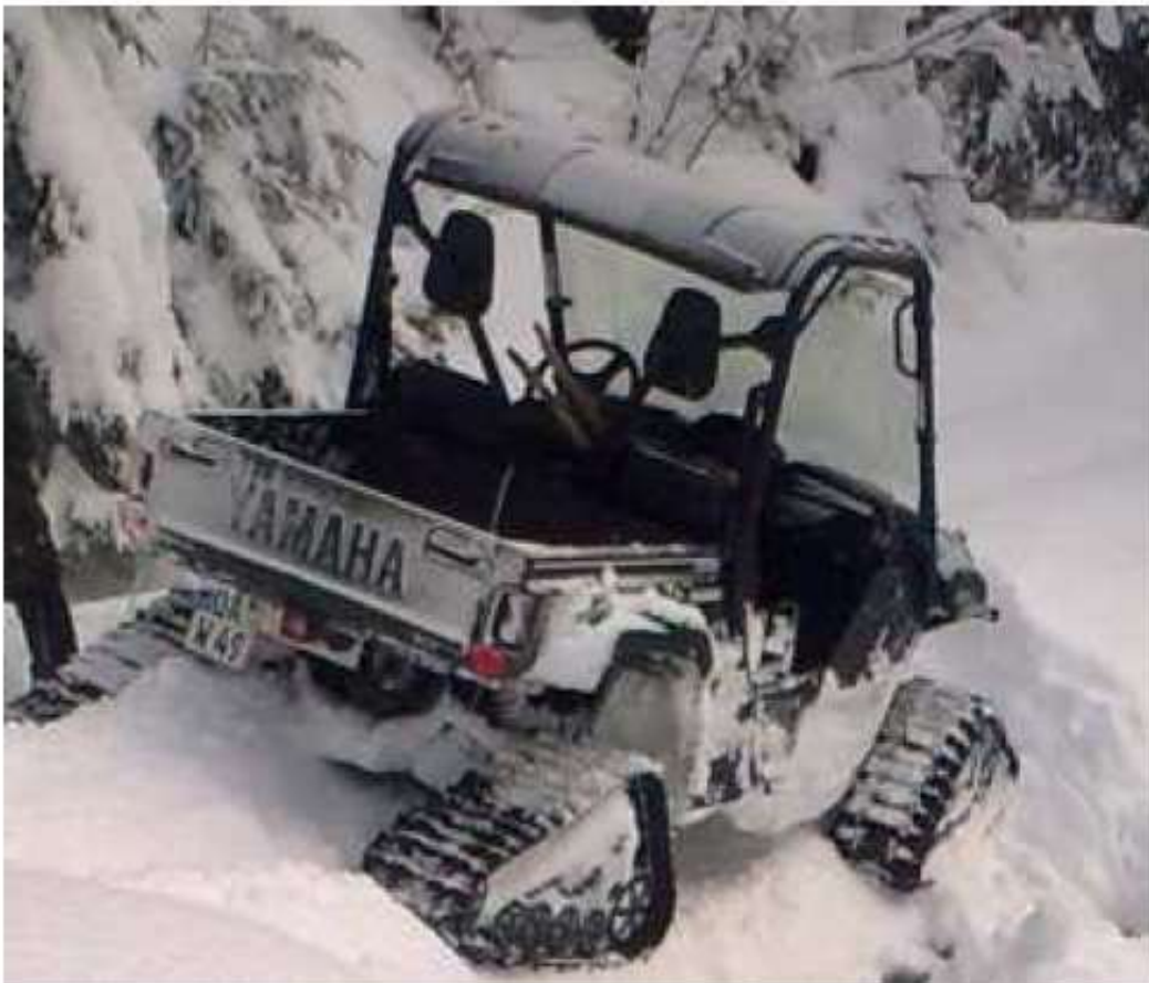
Revier Unterjoch 2010