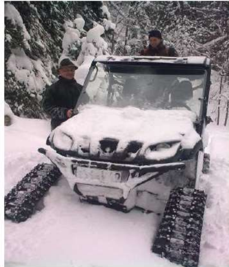
Revier Unterjoch 2010